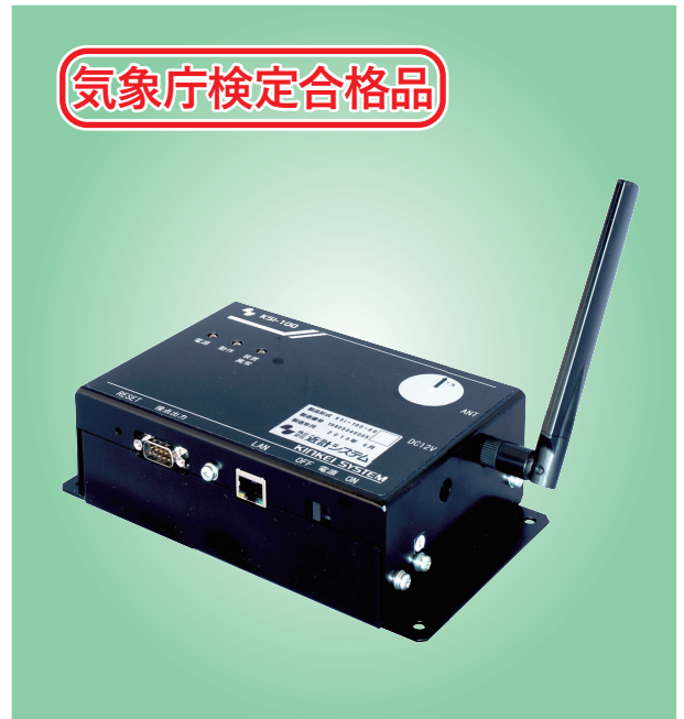
*電気通信事業届出番号: E-30-04185

震度情報をより多くの人に伝えるため、外部表示器として積層信号灯を採用 音と光で観測された震度階を確実にお知らせします